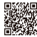
QRコードからもアクセスできます

※回収拠点については日本テトラパック環境本部が日本全国の方々から教えていただいた情報を基に作成しておりますが、各団体の都合により、アルミ付き紙容器の回収が現時点で行われていない可能性もあることをご理解ください。最新情報がありましたら、お知らせください。