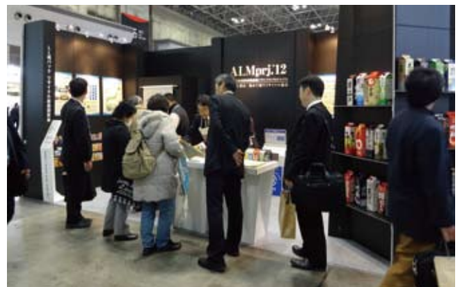
エコプロダクツ展 2012