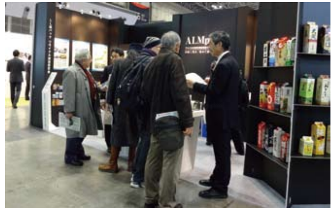
エコプロダクツ展 2012

日本テトラパック株式会社 環境課 金井/中島 東京都千代田区紀尾井町 6-12 電話 03-5211-2062 ファックス 03-5211-2195