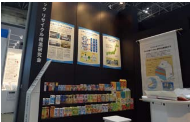
エコプロダクツ展 2012