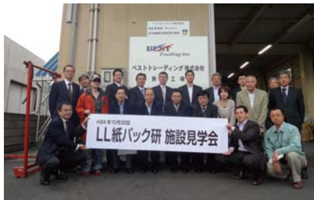
ベストトレーディング株式会社