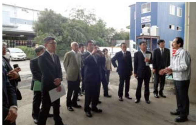
ベストトレーディング株式会社

実際に 2 社の工場を見学したことで、LL 紙パックの回収から再資源化へのリサイクル工程だけではなく、普段は知ることができない現場での課題や悩みなども教えていただき、非常に有意義な見学会となりました。排出事業者の中には、LL 紙パックはリサイク