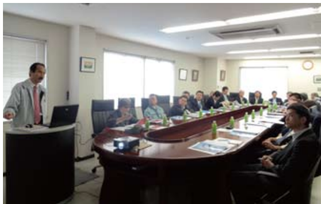
ベストトレーディング株式会社

また、「障害者が主役のリサイクル工場」を会社のテーマとして掲げ、障害者が働きやすい職場環境の整備と社会的地位向上を方針に社会貢献活動にも積極的に取り組まれています。