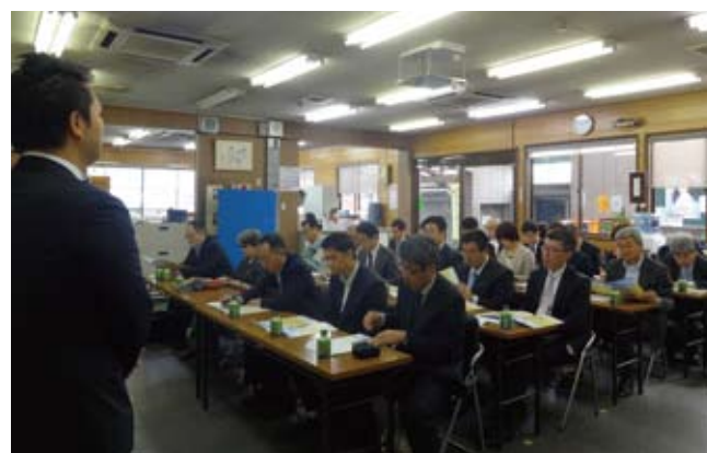
株式会社トベ商事

現在、LL 紙パックの回収量は、合計で 1 日に約 1 ベール（アルミなし・紙コップ含む）と少量ですが、洗浄加工後、ベラー・パレット化したものが 2、3 ヶ月に 1 回の頻度で再生紙会社に出荷されています。工場見学後は質疑応答の時間が設けられ、回収現場から見たリサイクルの現状や流通事業者と共同で取り組んでいるリサイクルステーションについてお話いただきました。また、長年に渡り、飲料容器のリサイクルに取り組まれている企業ならではのお話もあり、参加者から