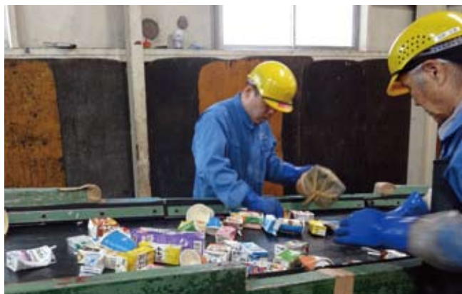
ベストトレーディング株式会社

LL 紙パックについては、主に自販機ベンダーや飲料メーカーから回収したものを取り扱っており、様々な異物が混ざった状態でも受入を行っています。その場合、作業員が異物を手選別で取り除き、洗浄破碎処理が施されます。製紙会社への出荷量は月に約 10 トン（アルミなし・紙コップ含む）となっており、定期的に週 1、2 回の頻度で出荷されています。