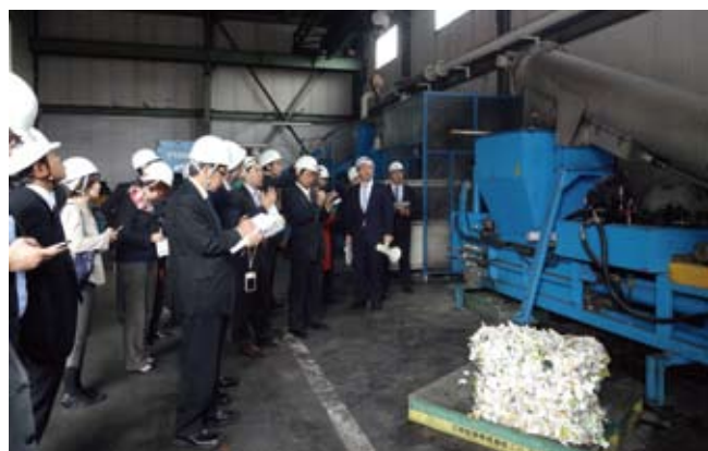
株式会社トベ商事