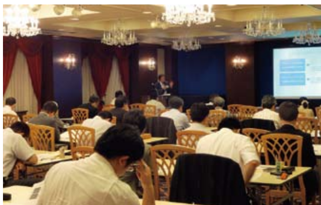
情報共有化勉強会